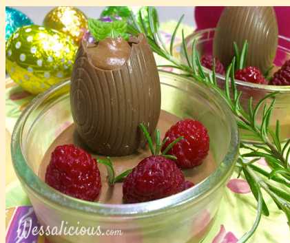
Gevuld paaseitje met chocomousse