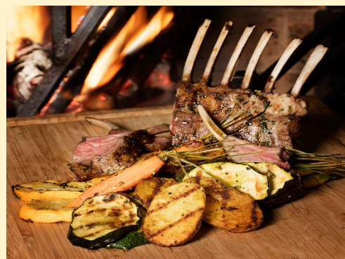
Lamskroontje lentegroentjes & gratin-aardappelen